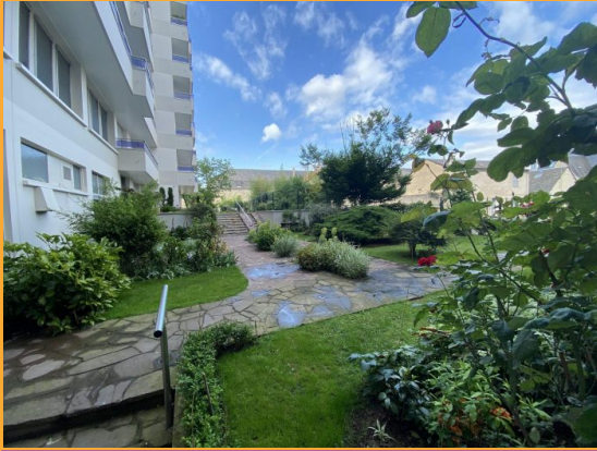
Coup de cœur

Référence 217 Coup de coeur - Appartement T3 de 78 m 2 orienté Est-Ouest avec terrasse (12 m 2 ), 4e étg asc. Séjour, 2 chambres, cuis. indé., amén. et éq. Sdb. Cave et pkg. BEG. Vue sur jardin. Chauffage gaz.